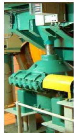
Figure 2 : vérin électrique d'iso-nivelage