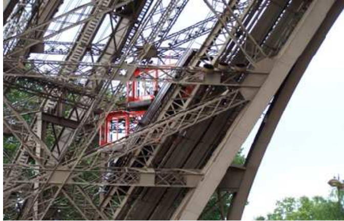
Figure 1 : chariot tracteur supportant les deux cabines de l'ascenseur du pilier nord de la tour Eiffel

La tour Eiffel est actuellement le monument payant le plus visité au monde avec plus de six millions de visiteurs par an. En plus des mille six cent soixante-cinq marches d'escalier, la tour Eiffel est actuellement desservie par six ascenseurs et un monte-charge. Les parcours annuels cumulés des ascenseurs sont, d'après le site officiel de la tour Eiffel, équivalents à deux fois et demie le tour de la Terre, soit plus de 103 000 km.